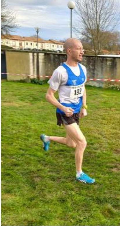
le coach sans ses chronos