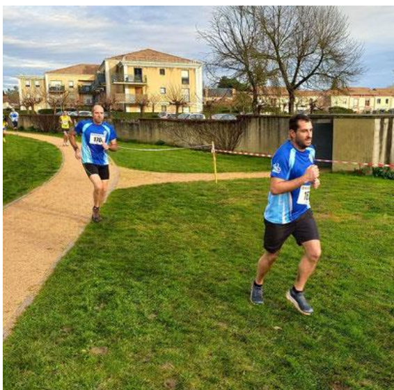
Romain c'est mieux un match de foot , au moins il y a une mi-temps et un ballon !