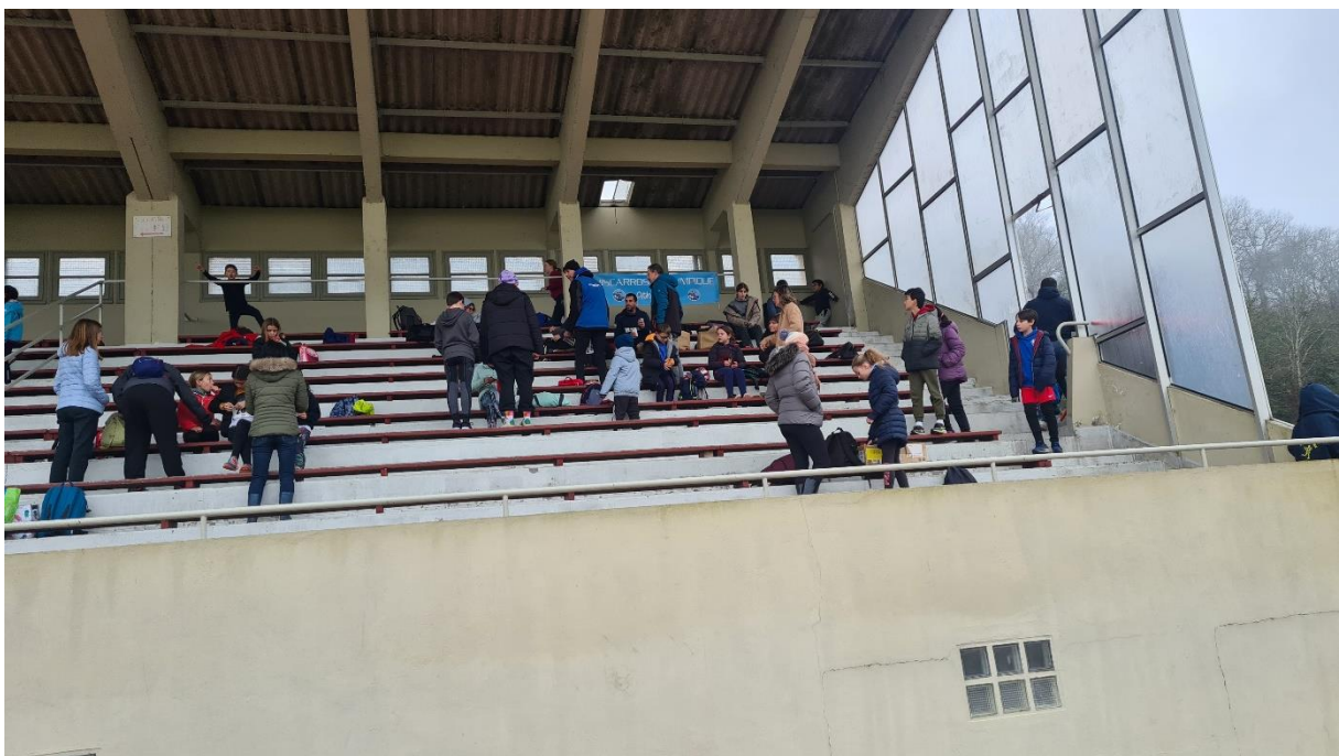
Installation dans les nouvelles tribunes du stade du rugby dans lequel il y a une magnifique piste d'athlétisme en tartan de 5 couloirs !!!!!!!!!!!!!!!!!!!!!!!