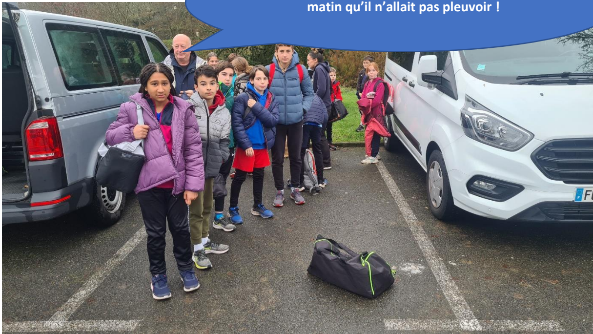
Arrivée à Aire sur Adour