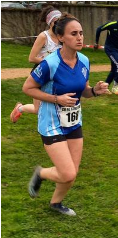
Les féminines du BOA en plein effort Bravo les filles !